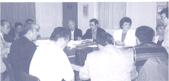
トロント市の市立老人ホーム見学