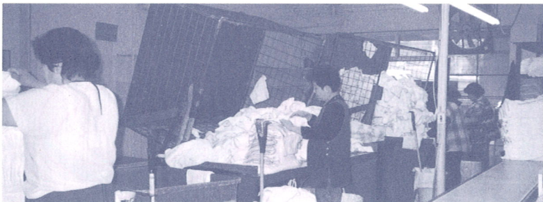
ベビーおむつレンタル会社見学 (シアトル・ベビーダイアパーサービス㈱)